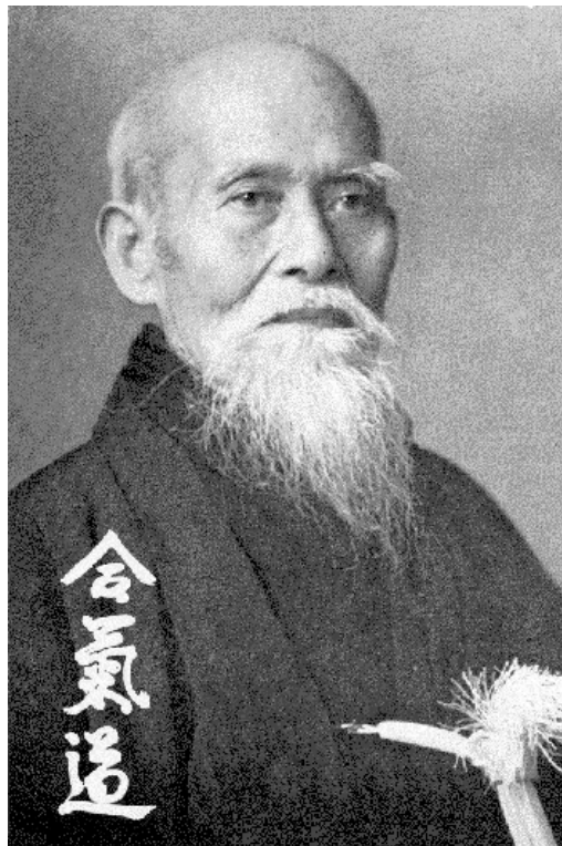
O'Sensei Morihei Ueshiba (1883-1969)