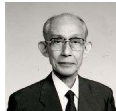
“Doshu” Sensei Kisshomaru Ueshiba

El Aikido ha sido uno de los artes marciales de mayor trascendencia en los últimos tiempos. En el 1976 la Organización de las Naciones Unidas declaró el Aikido como “ El arte marcial de la Paz ”. Gracias a la visión del “creador del Aikido”, el Sensei Morihei Ueshiba , de su hijo el Sensei Kisshomaru Ueshiba y de los esfuerzos de sus estudiantes más cercanos como el Sensei Yoshimitsu Yamada , el Aikido es hoy día reconocido y practicado en casi todas las partes del mundo.